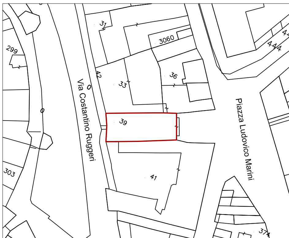
Planimetria catastale 1:1000 con evidenziato il fabbricato

Direttore generale Roberto Naccari Responsabile unico del procedimento